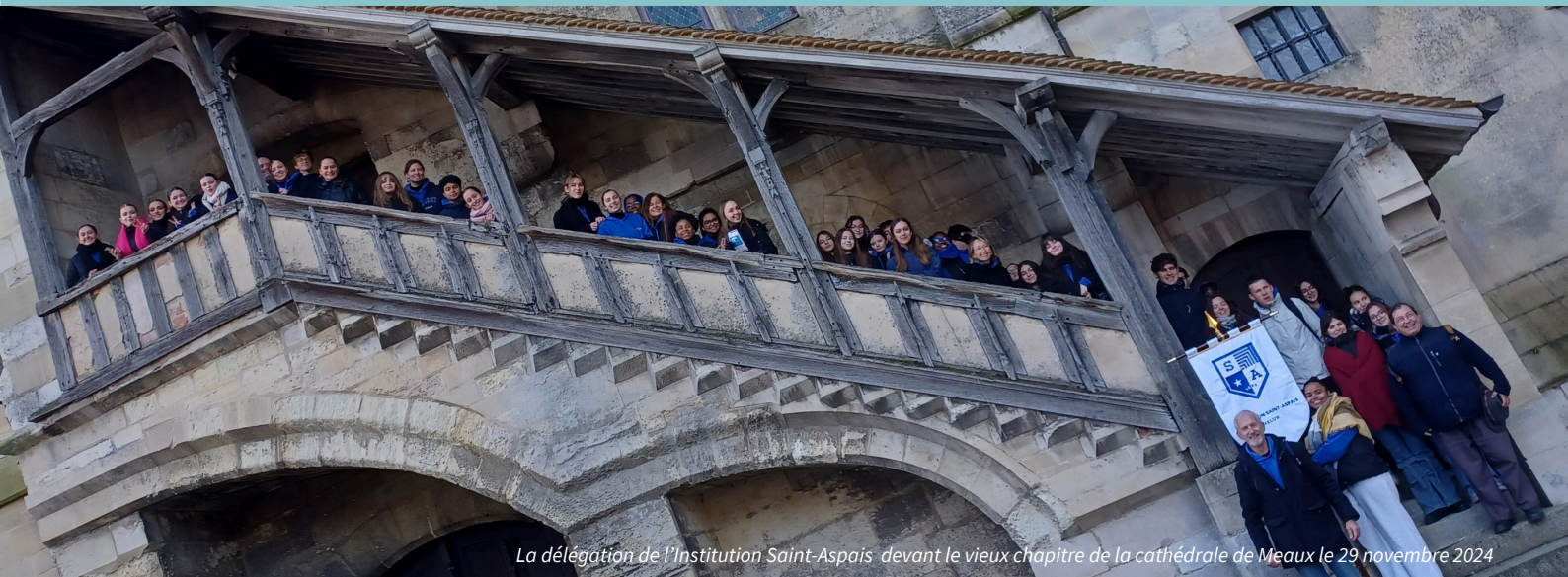
La délégation de l'Institution Saint-Aspais devant le vieux chapitre de la cathédrale de Meaux le 29 novembre 2024