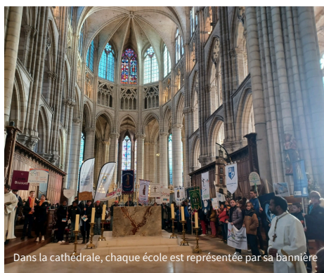
Dans la cathédrale, chaque école est représentée par sa bannière

Une fois celle-ci terminée, nous nous sommes rendus dans la grande salle de spectacle appelée "Colisée" toujours à Meaux.